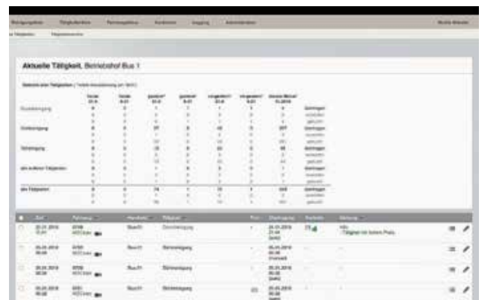
Das Server-Backend stellt auch die Übersicht der ausgeführten Arbeiten zur Verfügung.

Das Qualitätssicherungssystem umfasst mehrere Stufen und zwei Software-Komponenten: die mobile Website und die Kontrollen-App. Die Website ist für registrierte Benutzer auf allen Geräten, inklusive Smartphones, einsehbar. Sie gewährt den Vorarbeitern der Reiniger einen Echtzeitüberblick über die zu erledigen