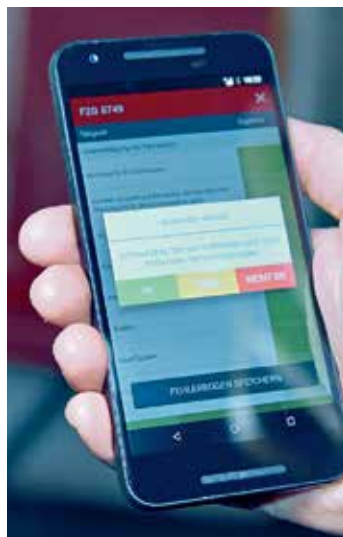
Mit der Kontrollen-App erfolgt die Durchführung der Qualitätskontrolle.

Die Gliederung der Aufgabenbereiche ist klar und durchdacht. Das Server-Backend ist die Schaltzentrale des Systems. Diese Softwarekomponente wird von den Administratoren und der Verrechnung genutzt. Hier kann das System entsprechend den eigenen Anforderungen konfiguriert werden. Geräte und Nutzer werden verwaltet, Tätigkeiten und Buchungen überwacht und Reinigungslisten erstellt. Bereits hier werden die Vorteile des Systems deutlich: Reinigungslisten für die nächste Reinigungsperiode müssen nicht mehr händisch erstellt werden, sondern werden auf Basis der hinterlegten Reinigungszyklen ganz einfach auf Tastendruck automatisch berechnet.