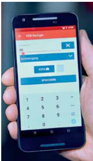
Eingabe der Fahrzeugnummer über die Reiniger-App.